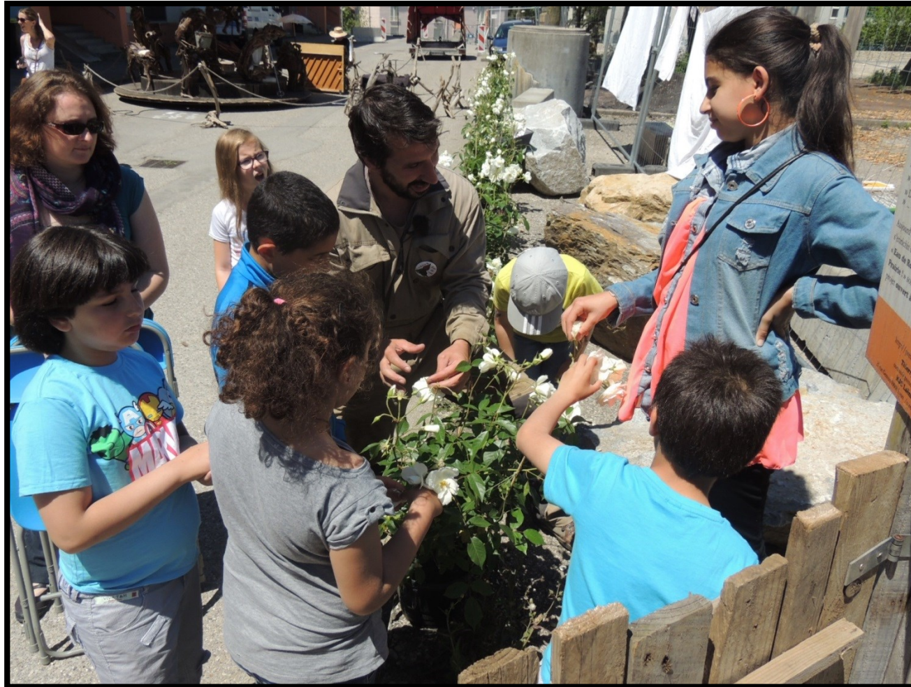
Mai 2014 // ROSABONHEUR Cueillette des fleurs avant distillation