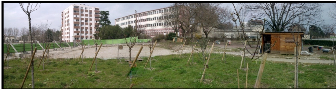
Pépinière urbaine de Prenez Racines !

Pendant ce temps, l'EAU DE ROSE creuse son lit et peut-être que vous allez nous y aider.