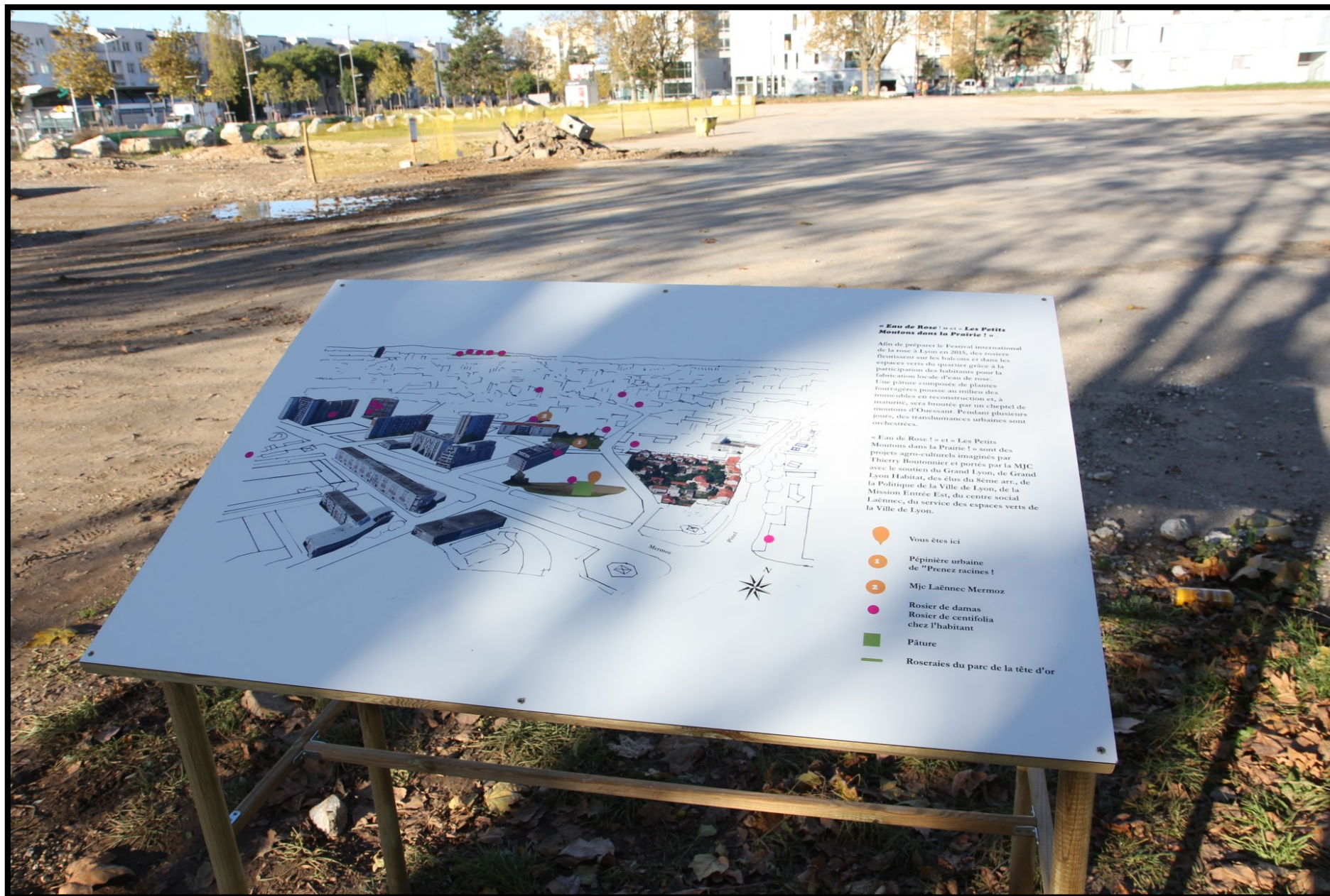
Table d'orientation installée sur la ZAC Mermoz montrant les foyers ayant adopté un ou plusieurs pieds de rosiers de Damas et Centifolia.